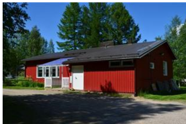
Hoiskontie 17 Eija-Liisa Kangas 2012