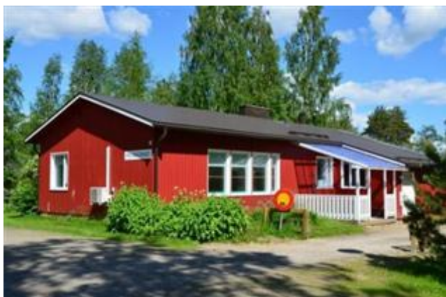
Hoiskontie 19 Eija-Liisa Kangas 2012