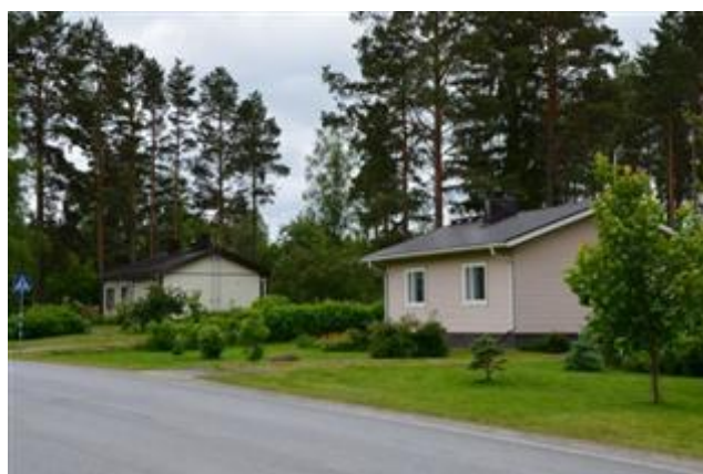
Hoiskontien varren 1960-luvun omakotitaloja, Hoiskontie 56 Eija-Liisa Kangas 2012