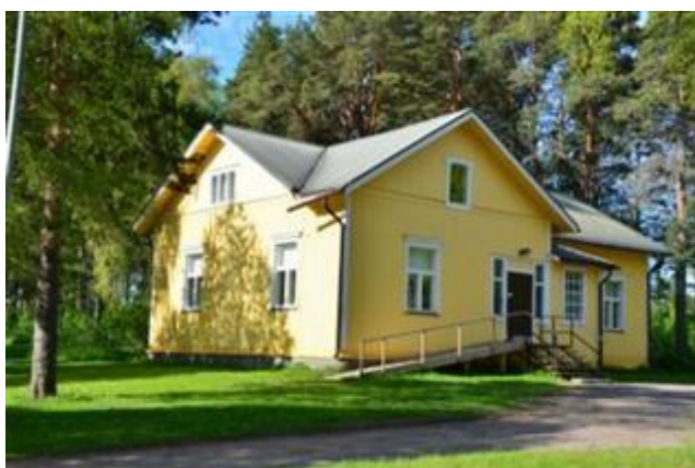
Pikkupappila Eija-Liisa Kangas 2012