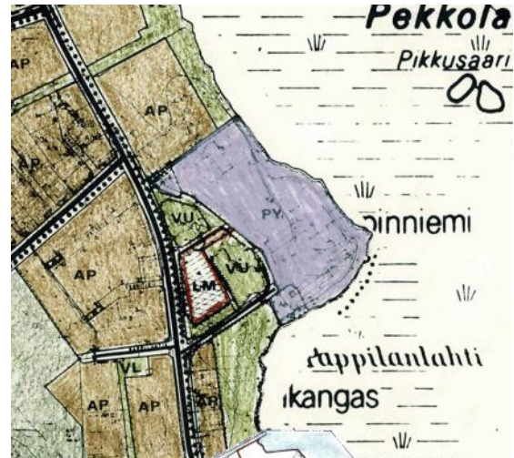
Kuva 2. Ote yleiskaavayhdistelmästä.

Suunnittelualueella on voimassa kaupunginvaltuuston vuonna 1984 hyväksymä (oikeusvaikutuksen) Kirkonseudun osayleiskaava, jossa alueelle on osoitettu asuntoaluetta (AP), julkisten palvelujen ja hallinnon aluetta (PY), liikennealuetta (LM) sekä virkistysalueita (VL, VU). Suunnittelualue sivuaa eteläpuolelta myös Alajärven ydinkeskustan osayleiskaavaa vuodelta 1994.