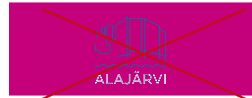
Taustalla käytetään tunnuksen väärää muotoa. Taustaväri ei sopiva.