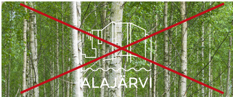
Tunnusta käytetään kuvapohjalla.