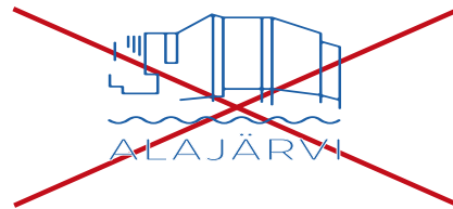
Logon mittasuhteet ovat väärät.