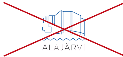
Logoelementit eivät ole samanvärisiä.