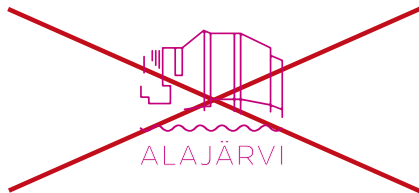
Tunnuksen värit väärät.