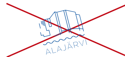
Tunnusta käytetään esim. kallistettuna.