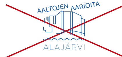
Suoja-alueelle sijoitetaan muita elementtejä.