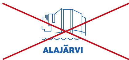
Tunnuksen tekstityyppi on väärä.